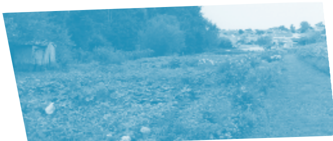
" Les Taches du Vanneau " (79) - O.FOUCAUD

Années 80 (du siècle dernier), années de crise économique, la frange de la population dite populaire se précarise. Les réponses du discours dominant mettent en avant les notions de l'entreprise, de l'insertion, sous-entendu par le travail, et de la flexibilité. D'autres petites voix naissent. Elles murmurent que la crise n'est pas qu'économique mais également sociale et culturelle. La population des exclus a de moins en moins le savoir faire et le savoir être pour résister. Les travailleurs sociaux constatent un risque de dérive du système qui renforce les comportements d'assistés en attendant de retrouver le mythique " plein emploi " des " Trente Glorieuses ".